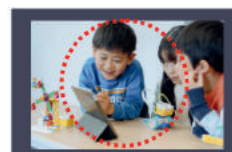
⑤お店や職場の様子