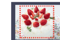
④紹介したいサービスや商品の全体とアップ 各3枚